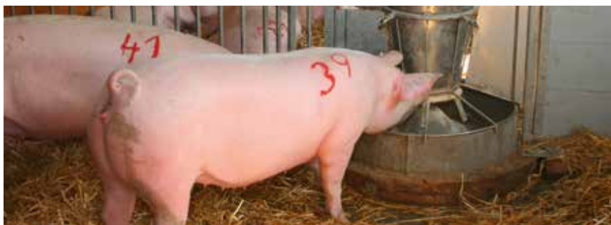
Schweine fressen meist aus Futtertrögen, in denen die Futtermittel mit Wasser verflüssigt sind.

schließlich mit den Backenzähnen. Flüssiges Futter wird mit Zunge und Kiefer eingesaugt. Wenn dabei Luft eingesaugt wird, kommt es zu den typischen Schlüpf- und Schmatzgeräuschen. Ein Schwein produziert etwa 15 Liter Speichel pro Tag, dieser enthält Enzyme, die schon im Maul mit der Stärkeverdauung beginnen. Das fertig zerkleinerte und eingespeichelte Futter kommt durch die Speiseröhre in den Magen . Dort wird das Futter mit dem sauren Magensaft vermischt, der die weitere Zersetzung anregt. Der Futterbrei gelangt danach in den Dünndarm , wo die eigentliche Verdauung stattfindet. Eiweiße, Kohlenhydrate und Fette werden durch Enzyme gespalten bzw. abgebaut. Die freigesetzten Nährstoffe werden durch die Darmzotten aufgenommen und im Blut weitergeleitet. Im Dickdarm sind Bakterien aktiv, die verschiedene Nährstoffe auf- und abbauen können. Hier wird vor allem Zellulose verdaut, allerdings nicht im gleichen Umfang wie im Pansen der Rinder. Der unverdauliche Rest des Futters wird im Mastdarm durch Entzug des Wassers eingedickt und als Kot ausgeschieden.