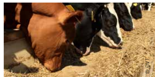
Die Koppelprodukte aus der Ernährungswirtschaft besitzen wertvolle Nährstoffe für z. B. Milchkühe.

So kommen in Futtermitteln Produkte in Lebensmittelqualität zum Einsatz.