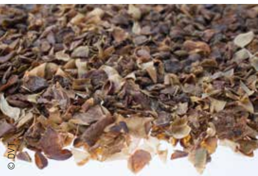
Beispiel Apfelfrestler: Er entsteht beim Pressen von Apfelsaft aus rohen Äpfeln. Wiederkäuern liefert er Energie, Ballaststoffe und Eiweiß.

In beiden Fällen kann „der Keks ohne Ecke“ zum Einsatz kommen, denn Mischfutter werden bedarfsgerecht aus bis zu 20 Bestandteilen hergestellt (s. Kasten). Etwa die Hälfte der Zutaten bzw. Einzelfutter im Mischfutter stammt aus der Ernährungswirtschaft und beruht so auf Rohstoffen in Lebensmittelqualität – wie die bereits genannten Kleien, Schrote und Trockenschnitzel, Rapsölkuchen sowie Keksmehle & Co. So können die Tiere Produkte nutzen, die in der Lebensmittelwirtschaft nicht weiter verwendet würden.